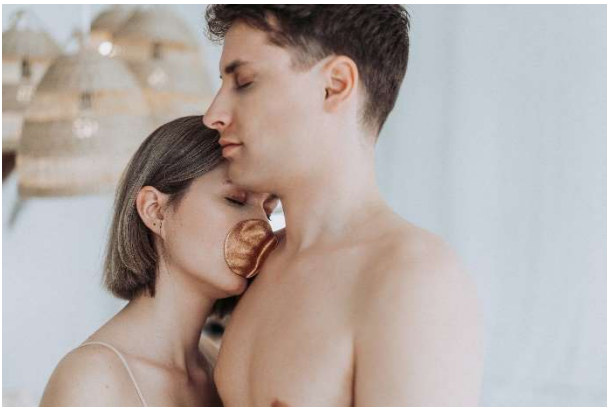
Csenge Diriczi. SENSE I s. 2021. Kupfer, Elektroformung

Gesellschaft für Goldschmiedekunst e.V. Deutsches Goldschmiedehaus Hanau Altstädter Markt 6 63450 Hanau T 06181 – 256556 info@gfg-hanau.de www.goldschmiedehaus.com www.instagram.com/deutsches_goldschmiedehaus/ https://www.facebook.com/DeutschesGoldschmiedehaus/